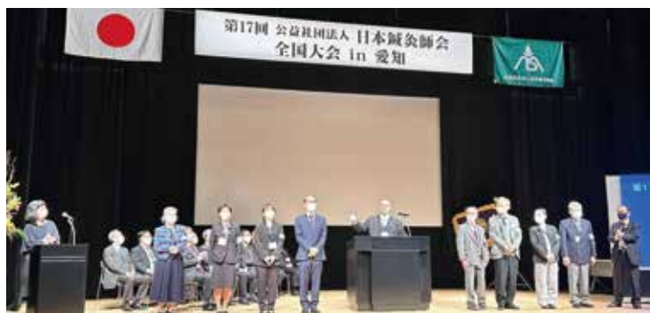
大会実行委員会のメンバー