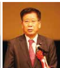
鍼灸マッサージを考える国会議員の会 衛藤晟一会長