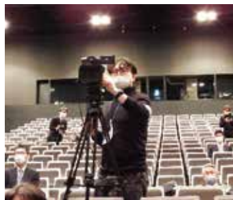
自前のカメラで配信