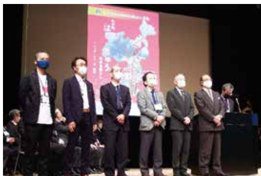
近畿ブロック師会長一同