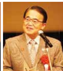
愛知県 大村秀章知事