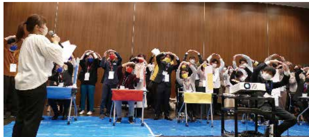
繋がろう、学生の輪

では、全国の学生が5チームに別れてクイズに挑戦をしました。経穴・解剖学・生理学・ご当地問題・東洋医学概論などの出題があり、浮き物通し競争もおこなわれました。参加チームには豪華賞品が用意されました。他校の学生同士が協力して問題に取り組み、大いに盛り上がり、「輪」が繋がるワークショップとなりました。