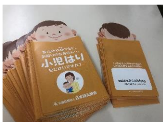
〈小児はりパンフレット〉