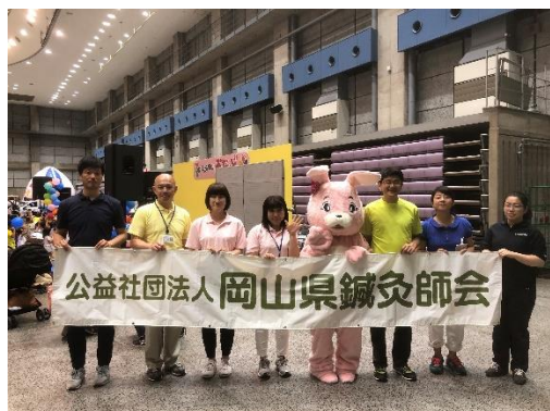
〈1日目:6月29日参加スタッフ〉

女性部会委員会のイベントとして、子育て支援に貢献できるよう、また多くの人に鍼灸業界を認知して頂けるよう次年度にもつながればと思っています。