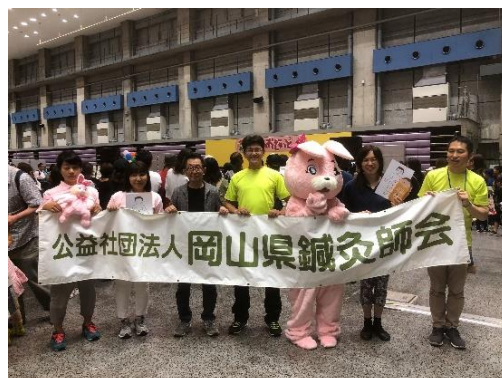
〈2日目:6月30日参加スタッフ〉